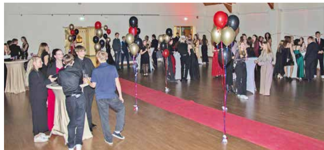
Loo kooli ühisball.

Suurt menulist kogus ka aula ees asetsev fotofox , kus oli võimalik sõpradega mälestusväärseid jäädvustusi luua. Fotofoxiga oli kaasas valik erinevaid aksessuaare, mis pildile lõbusa kontrasti löid.