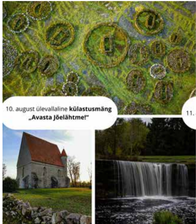
10. august ülevallaline külastusmäng „Avasta Jõelähtme!“