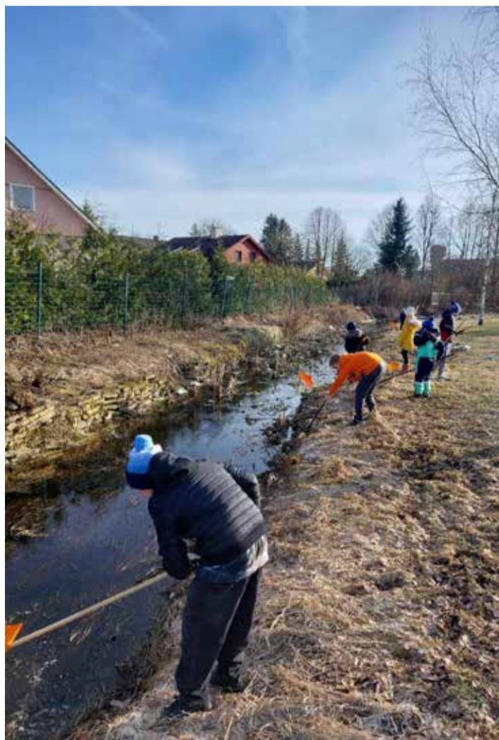
Noored oja ääres.

Suur aitäh OÜ-le Tootjavastutusorganisatsioon, kes võttis vaevaks ja pakkus meile seda toredat koolitust täiesti tasuta ning tänusõnad ka tublidele hakkajatele noortele! •