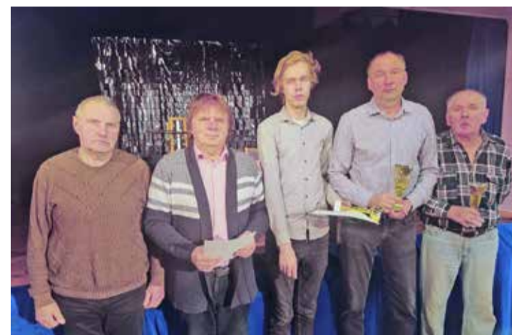
I koht – võistkond VANA HÕBE.