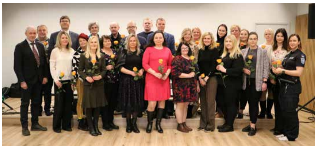
Ühispilt päevakeskuse ja valla sotsiaaltöö tegijatest ja koostööpartneritest.

Sotsiaaltööd tegeva töötaja roll on olla inimese kõrval, toetada ja nõustada teda elus