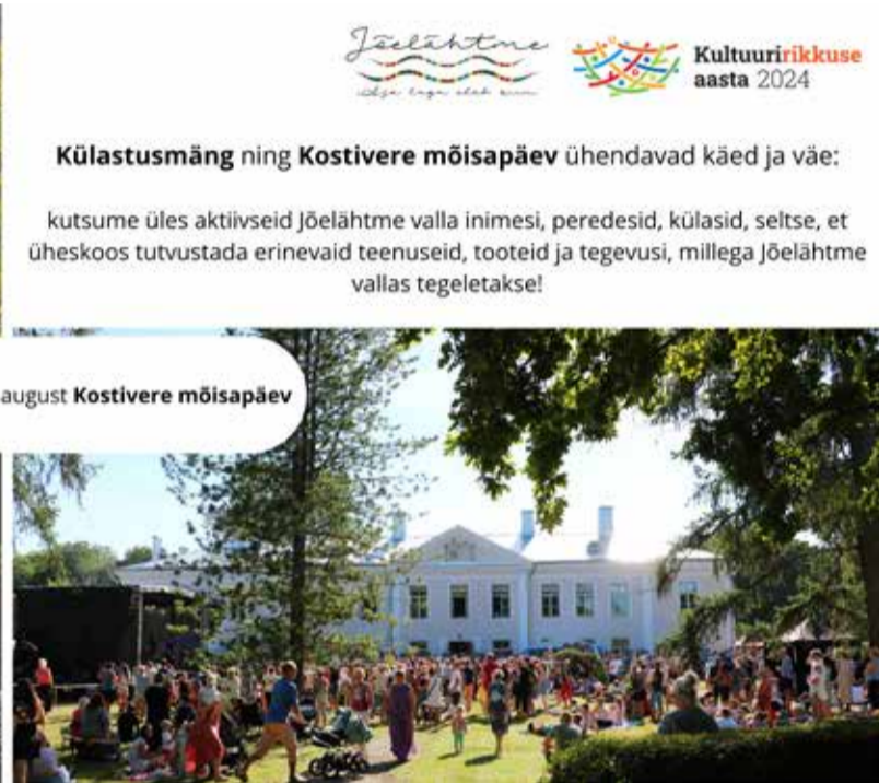
11. august Kostivere mõisapäev

Külastusmäng ning Kostivere mõisapäev ühendavad käed ja väe: kutsume üles aktiivseid Jõelähtme valla inimesi, peredesid, külasid, seltsi, et üheskoos tutvustada erinevaid teenuseid, tooteid ja tegevusi, millega Jõelähtme vallas tegeletakse!