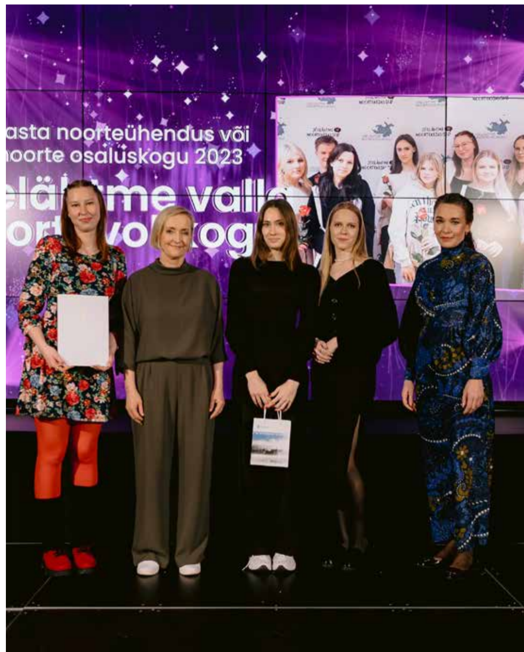
Jõelähtme valla noortevolikogu ning haridus- ja teadusminister Kristina Kallas.

Plaanis on viia läbi mitmeid küsitlusi Jõelähtme noorte seas, mille läbi saame teada, kuidas nende elu ikka edendada. Oleme noortele alati suureks toeks